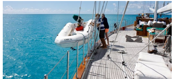
Die Crew der KAIRÓS hat das nächste Ziel im Blick

Von hier aus nimmt die KAIRÓS wieder Kurs auf die große Schwesterinsel, auf Malta. Vorbei an der Küste Gozos, die sich bis zu 176 Meter aus dem Meer erhebt. Hier und da ragt ein Kirchturm aus der Inselsilhouette, „der Papst war sogar mal auf Gozo“, wird vielleicht jemand an Bord einwerfen. Später kommt der Santa Marija Tower im Südwesten Cominos in Sicht, ein ockerfarbener Klotz, der hier im Auftrag des Malteserordens zur Verteidigung gegen Piraten errichtet wurde. Und dann, am letzten Tag der Reise, fährt die KAIRÓS wieder ein in den atemberaubenden Naturhafen, in dem es so anders aussieht als ein, zwei Inseln weiter. Atmen Sie durch, lassen Sie die Kulisse auf sich wirken. Lassen Sie sich verzaubern. Wie auf Comino. Wie auf Gozo. ■