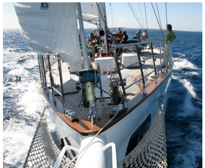
KAIRÓS: Hingucker und Schmuckstück eines jeden Ankerplatzes

Malts Hauptstadt Valletta ist ein Frei- lichtmuseum – und gehört zum UNESCO Weltkulturerbe