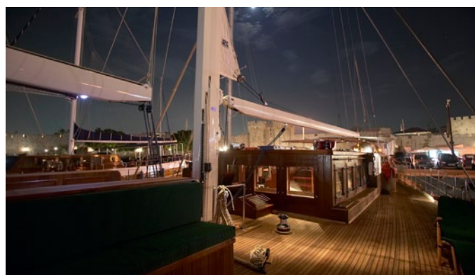
■ Für die maximal 18 Gäste an Bord der KAIRÓS wird es nie eng

Zwischen Felsen und Höhlen leuchtet kristallklares Wasser magisch in allen Blautönen des Farbspektrums. Leise klatschen die Wellen an den Bug der KAIRÓS. Zeit für ein Bad mit Karibik-Feeling. Und sollte Ihnen die Kulisse bekannt vorkommen – das kann sein: Die „Blue