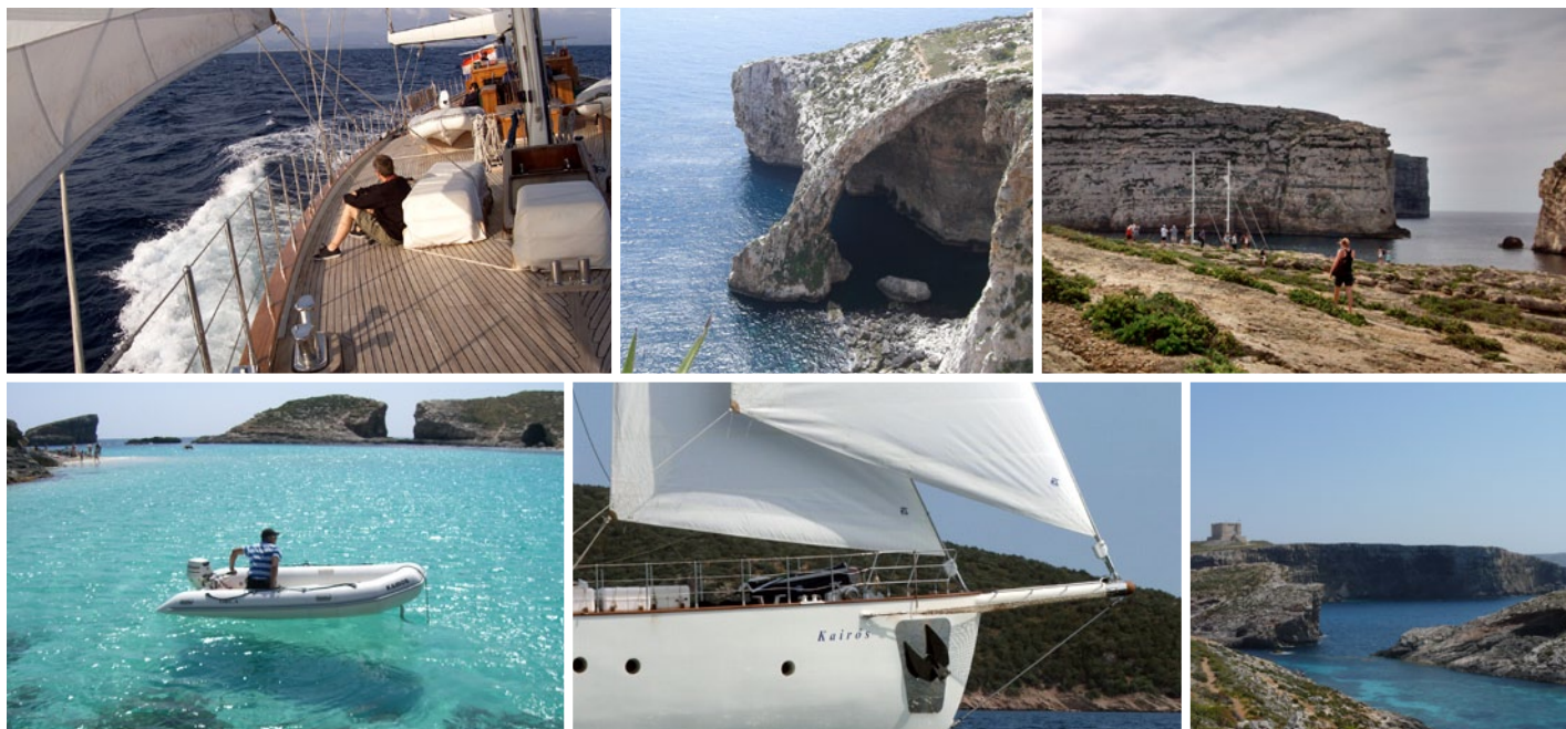
■ Auf der KAIRÓS wird richtig gesegelt: von Malta über Comino (mit einem Stop in der Blauen Lagune) nach Gozo und zurück

Ihren Frühstückskaffee werden Sie in den kommenden Tagen wahrscheinlich an Deck genießen, das rund 38 Meter lang ist und komplett aus Teak. Und meist wird die Crew unter Kapitän Dominique Geysen im Anschluss daran die Segel setzen – insgesamt über 550 Quadratmeter Segelfläche. Vielleicht möchten Sie dabei helfen oder einmal das große runde Steuerrad der KAIRÓS übernehmen?